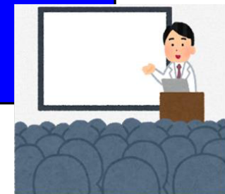
外部講師による講演会