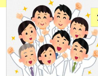
保健・医療現場の見学